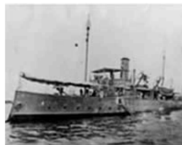
Cañonero "Francisco de Miranda".

"Para el 15 de febrero del año de 1897, (...) se ordenó el receso del alumnado del Instituto (Escuela Náutica de Venezuela), mientras se acondicionaba como Buque-Escuela el vapor de Guerra Zamora (antiguo buque frutero que, con el nombre de Derwent, fue adquirido en Londres por el Comisionado de Venezuela, al cumanes Doctor Claudio Bruzual Serra), que al quedar listo dio móvil a la siguiente Resolución del día 4 de junio de 1897.- 86° y 39°. Y publicado en Gaceta Oficial N° 7.030, Caracas, sábado 5 de junio de 1897. 'Organizado como ha sido a bordo del Vapor nacional de guerra Zamora el nuevo departamento destinado al Instituto Escuela Náutica, se fija, por disposición del Presidente de la República, el término de quince días, a contar desde esta fecha, para que los alumnos que se encontraban en receso, concurran a continuar sus estudios; y los que no lo hicieron, quedarán de hecho separados del mencionado Instituto.'" (2)