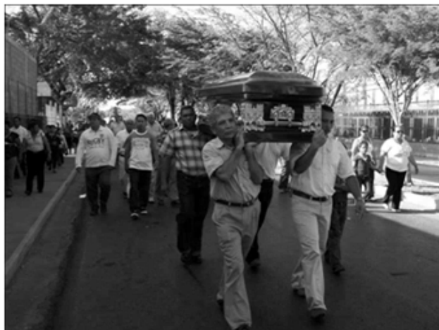
Los deudos del escultor Ignacio Arenas cargando el féretro hasta el cementerio como una demostración de afecto. Cumaná 2009.

A la fecha que escribo estas notas aún está en el mismo lugar el bar El Descanso, atendido por los dueños de siempre: la familia Montañés. Los borrachines de la esquina ya no se reúnen para esperar al muerto pasar, es probable hayan encontrado otros trabajos menos pesados y riesgosos; si a ver vamos, y recordamos algún "entierro de malandros" con sus veleidades. Ahora los entierros pasan por los lados de la Iglesia de Santa Inés o la plaza Rivero, es menos empinada la cuesta que por los lados de la plaza Pichincha. Ha sido difícil desarraigarnos de esta costumbre, aun permanece arraigada en el sentimiento popular de los barrios cumaneses.