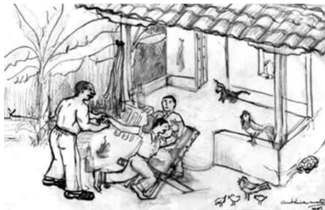
Ilustración: Antolina Martell / 2009