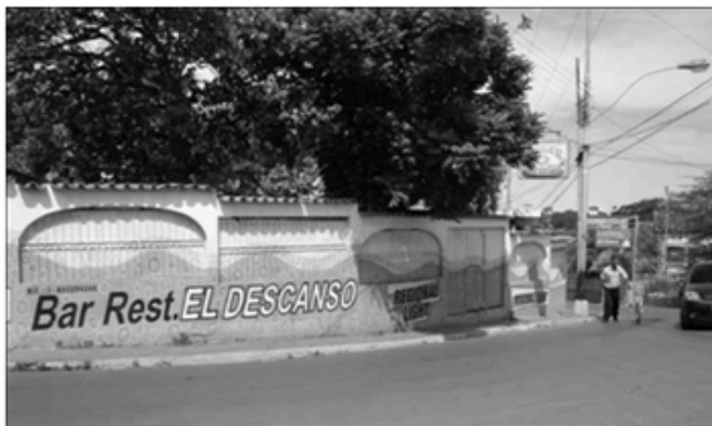
Bar El DESCANSO. Cumaná 22 de agosto 2009.

A la fecha que escribo estas notas aún está en el mismo lugar el bar El Descanso, atendido por los dueños de siempre: la familia Montañés. Los borrachines de la esquina ya no se reúnen para esperar al muerto pasar, es probable hayan encontrado otros trabajos menos pesados y riesgosos; si a ver vamos, y recordamos algún "entierro de malandros" con sus veleidades. Ahora los entierros pasan por los lados de la Iglesia de Santa Inés o la plaza Rivero, es menos empinada la cuesta que por los lados de la plaza Pichincha. Ha sido difícil desarraigarnos de esta costumbre, aun permanece arraigada en el sentimiento popular de los barrios cumaneses.