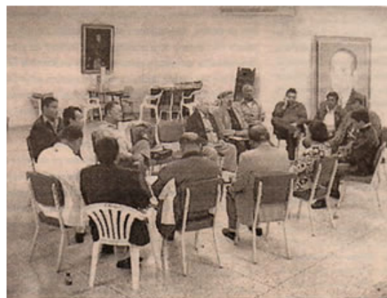
El Ayuntamiento cumanés escuchó atentamente los planteamientos de la comisión

En la continuación para alcanzar la declaración de Cumaná como Patrimonio Cultural de la Humanidad, por parte de la UNESCO se creó la Dirección Ejecutiva del Programa «Ciudad de Cumaná Patrimonio Cultural» y la Fundación Cumaná Patrimonio de la Humanidad, la cual fue juramentada por el Secretario de la Universidad de Oriente, como podemos leer en Siglo 21, (2005a).