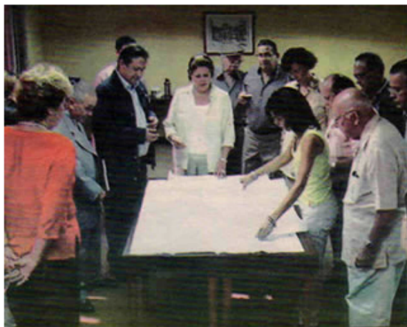
Los integrantes de la comisión evaluaron la propuesta de Méndez

computación y la sede de la Comisión Cumaná Patrimonio Cultural. Luego de la explicación, integrantes de la comisión realizaron una serie de recomendaciones para mejorar la distribución de los espacios. Al concluir la reunión se acordó nombrar tres subcomisiones que asesoran a Méndez, con el objetivo de presentar un proyecto definitivo en la próxima reunión a realizarse el 8 de marzo, en la capital sucrense. (El Tiempo, 2006 a .)