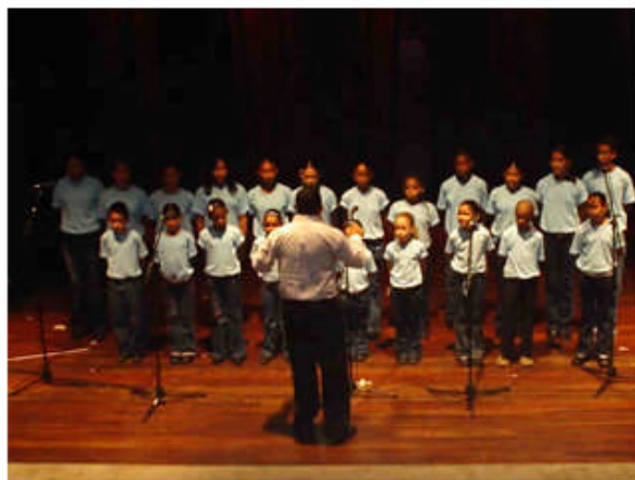
Primera presentación del coro infantil

Para finalizar podemos recordar que ante la presencia de algunos problemas de la comunidad, desarrollamos eventos para tratar de colaborar en la búsqueda de solución a ellos, como es el caso de ayudar a solucionar el problema de enfrentamiento entre jóvenes de la ciudad. Así mismo se fortaleció una red de museos como el Museo del Mar y El hombre insular, por estar convencidos que dentro de los programas educativos, los museos colaboran con la formación