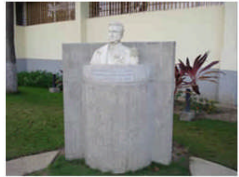
Busto de Antonio José de Sucre

donde se lee, "Aportamos Bs. 53 millones como anticipo para iniciar los trabajos destinados a la culminación de la obra Paseo Los Ilustres Sucrenses de dicha casa de estudios" .