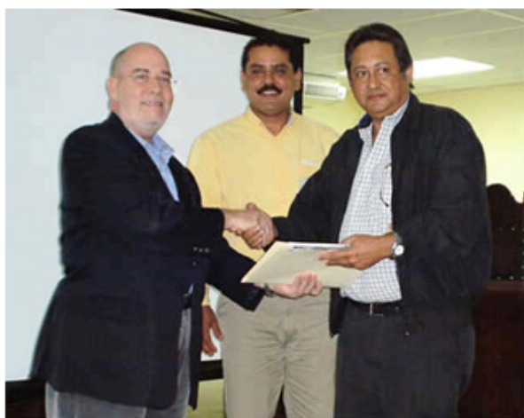
Entrega del Proyecto.

Luego intervinieron el director ejecutivo FESNOJIV, mi persona y el alcalde del municipio Sucre, quienes además de manifestar su satisfacción por este proyecto expresaron sus deseos para que el mismo sea una realidad lo más pronto posible y para ello es necesario aunar esfuerzos entre todas las instituciones formantes de este convenio e incluso de otros organismos para solicitar recursos que permitan en un futuro, no muy lejano la construcción de la sede para estas orquestas, que son parte de ese programa nacional del Sistema de Orquestas Sinfónicas.