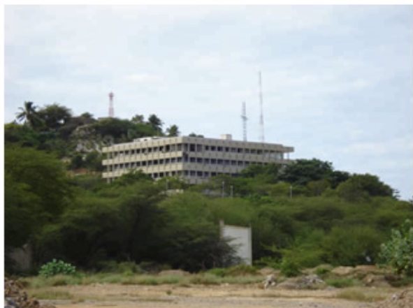
Centro Cultural Luis Manuel Peñalver

Fue un día de mucho significado para la institución y en particular para mi persona el abrir, el 14 de diciembre del 2005, las puertas de aquel edificio. Por este motivo, como Rector en