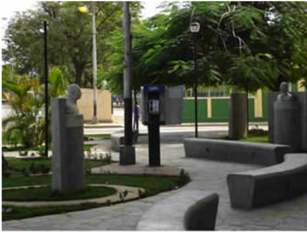
Paseo de Ilustres Sucrenses

En aquella insistencia por tratar de dar a conocer tantos ilustres cumaneses de la época de la colonia y que a nuestro particular nos llenan de orgullo, además de crear el salón de Ilustres Sucrenses se logró se construyera el Paseo de Ilustres Sucrenses al frente de la principal sede de la Universidad de Oriente, el Rectorado, financiada esta obra por el banco Banesco como se puede verificar en su Informe (2005a), en