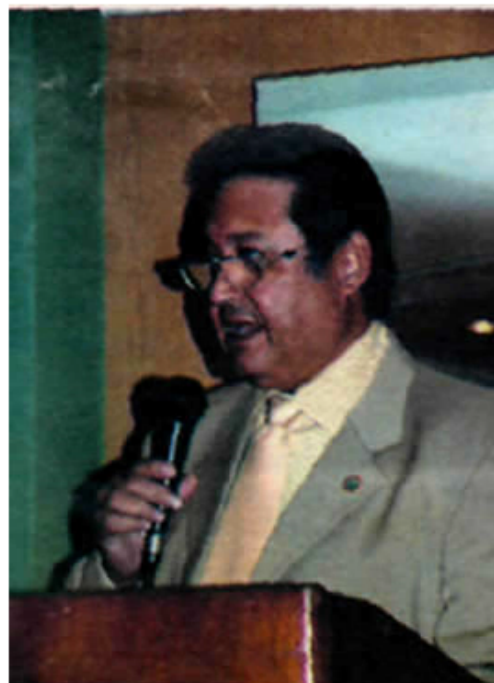
Rector Pedro Mago H. Rector de la UDO

En la actualidad La Casa Más Alta cuenta con una sala de videoconferencia ubicada en el Núcleo de Sucre, específicamente en la planta baja del edificio del Instituto Oceanográfico. (Álvarez, 2006p)