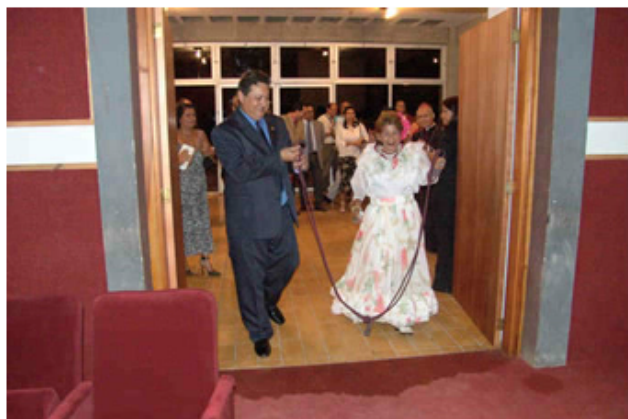
Inauguración Teatro María Rodríguez

fundador, luego la exposición de las obras de los artistas sucresenses y la inauguración del teatro María Rodríguez.