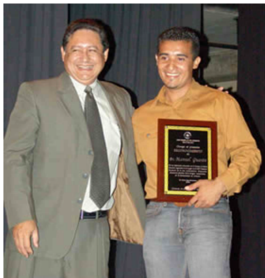
Estudiante UDO ganador voz universitaria.

una placa de reconocimiento a cada uno de ellos. Entre los homenajeados se encontraban los estudiantes del Núcleo de Anzoátegui que fabricaron el carro de competencia Fórmula SAE, el mejor atleta de los juveniles, el ganador de poesías a nivel nacional, los estudiantes premiados por el mejor trabajo de grado a nivel internacional, mejores voces universitaria a nivel nacional, etc.