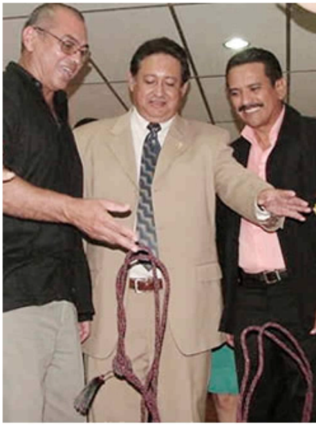
Inauguración sede Parque Tecnológico Foto Prensa UDO.

Fue a un año del inicio de mi gestión rectoral cuando se comenzó a manejar la idea de crear el Parque Tecnológico y se comenzó a darle impulso. Se realizaron varias reuniones con personalidades del mundo económico de la región, con