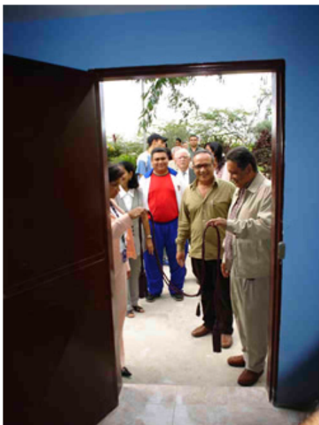
Inauguración Escuela de Música