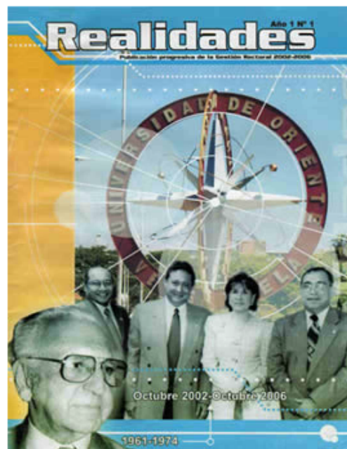
Portada de la revista Realidades