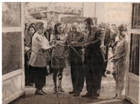
El Rector, el Secretario, la Decana del Núcleo de Anzoátegui y la Coordinadora de Publicaciones del Rectorado de la UDO, despejando la cinta inaugural.

La II de estas ferias se realizó en el Centro Comercial Plaza Mayor de Puerto La Cruz, desde el 27 de noviembre hasta el 15 de diciembre del 2004. En ella participaron más de 60 casas editoriales nacionales e internacionales y las instituciones de educación superior estuvieron representadas por las asociaciones encargadas de la edición de bibliografía, tales como Consejo de Publicaciones ULA, Universidad del Zulia, Universidad de Carabobo, Librería IESA, Universidad Central de Venezuela, Universidad Alejandro Humboldt, Universidad Bicentennial de Aragua, Universidad José Antonio Páez, Universidad Tecnológica del Centro.