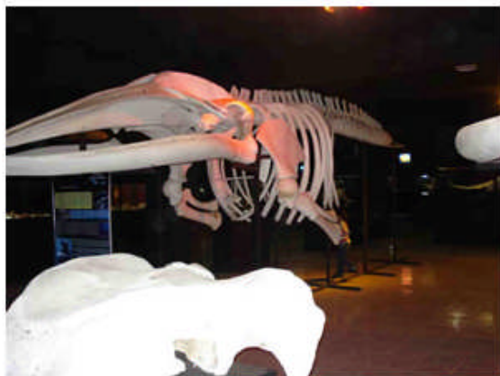
Museo del Mar

Concluyo esta parte aclarando que al término de mi mandato como Rector dejé iniciados los trabajos y el equipamiento para la construcción de una sala para once acuarios.