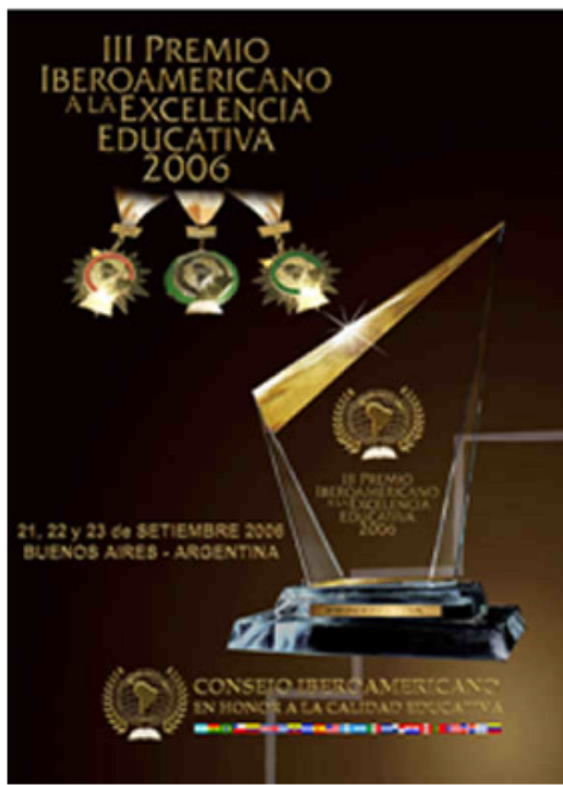
Trofeo a la Excelencia Educativa 2006 - A nombre institucional