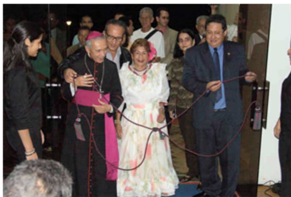
Inauguración del Centro Cultural Luis Manuel Peñalver

darle más vida cultural y para colaborar con el proyecto Cumaná Patrimonio de la Humanidad.