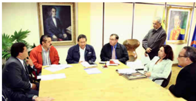
Firma convenio UDO-Alcaldía.

una sede adecuada, sólo un espacio cedido por la directiva del Colegio Nacional de Periodistas, Seccional Sucre, que no reúne las características para una agrupación conformada por 120 niños y jóvenes.