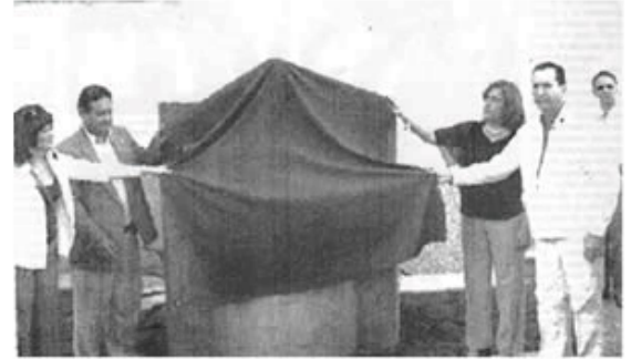
Inauguración Paseo Ilustres Sucrenses

Ahora la Universidad de Oriente, en la persona del doctor Pedro Mago Heminson, próximo a culminar sus cuatro años de mandato al frente de nuestra máxima casa superior de estudios, nos brinda esa gran oportunidad de saber más de nuestros ilustres en este paseo que acaba de inaugurar. (Coronado, 2006c).