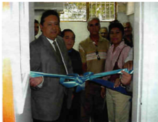
Inauguración Servicio Odontológico en sede de ASMOC. Cumaná