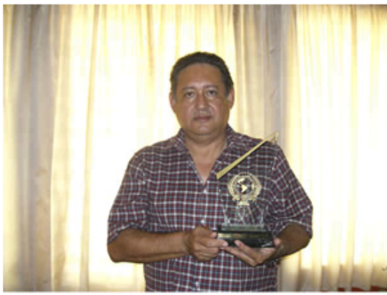
Premio en Honor a la Excelencia Educativa 2006.