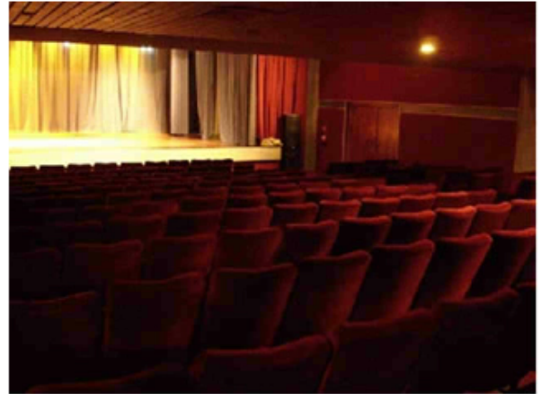
Sala del Teatro María Rodríguez

En la sede funciona el Museo del Mar y en los próximos meses se aspira que funcionen en el edificio todas las dependencias culturales de la Universidad. Puche, (2005a)