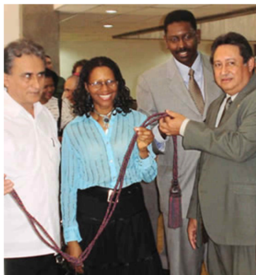
Inauguración sede Centro de Estudios del Caribe

desarrollar las herramientas adecuadas que permitan enfrentar los conflictos o problemas que provoca el proceso de integración.