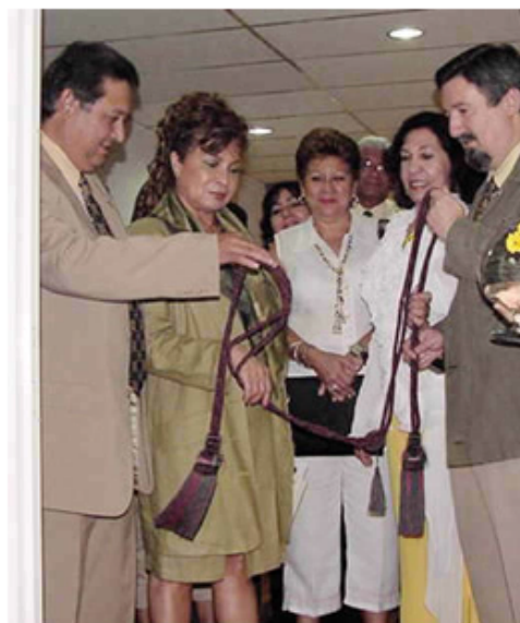
Inauguración sede Centro de filosofía para niños Realidades 2006e.

Fue el jueves 29 de junio del 2006, a las 9 am cuando en el segundo piso del Complejo Cultural Luis Manuel Peñalver se abrieron las puertas de la sede del Centro de Filosofía para Niños, proyecto dirigido a crear sentido de reflexión para la vida de nuestros niños desde la imaginación creativa, la indagación y el espíritu de búsqueda de su propia verdad, es decir, es un proyecto para enseñar a pensar a los niños de nuestra ciudad, hacerlos críticos, de allí la gran pertinencia que tiene para nuestra ciudad.