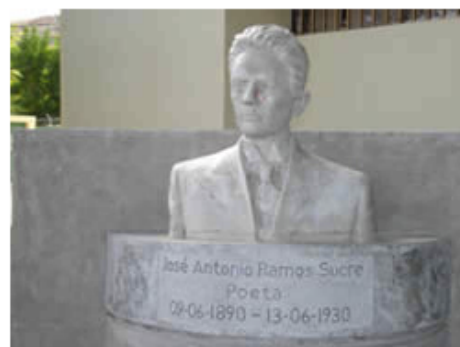
Busto de José A. Ramos Sucre