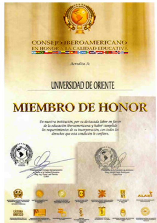
Título Honorífico de Doctor Honoris Causa - A nombre del representante.