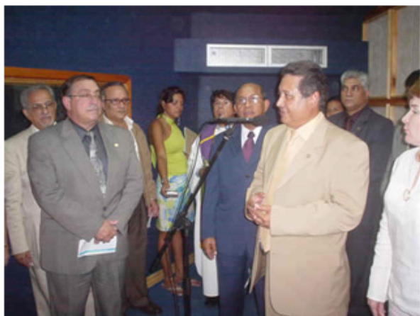
Ceremonia inaugural del "Audio Studio 58 "

fue inaugurado dentro de la programación para celebrar dos años de mi gestión rectoral.