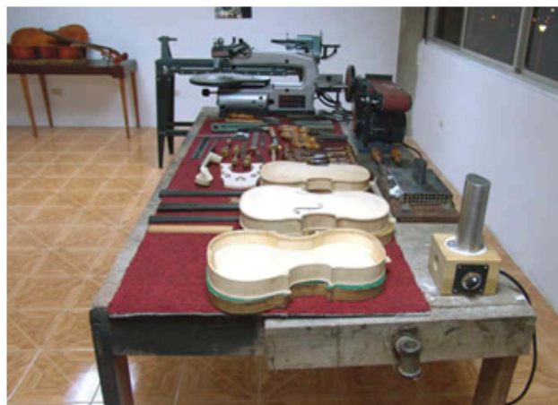
Taller de Luthería

En ese acto de inauguración, los presentes disfrutaron de la Orquesta de Cámara, quienes interpretaron cuatro canciones entre las que se encontraron: Adiós Nonino de Astor Pizola; La Muerte del Ángel del mismo autor; Fuga Criolla de Juan Bautista Plaza y Fuga con Pajarillo de Aldemaro Romero.